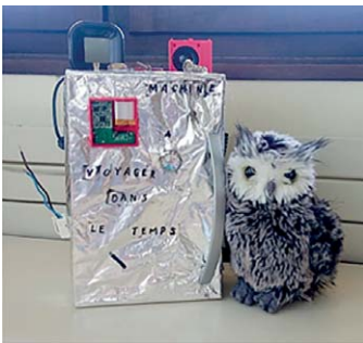
La mascotte de la classe des petits grands et sa machine à voyager dans le temps

Une rentrée réussie pour les 112 élèves de l'école maternelle de Neuvecelle ainsi que pour les grands, 7 enseignantes dont deux nouvelles collègues et toujours nos 4 ATSEMs !